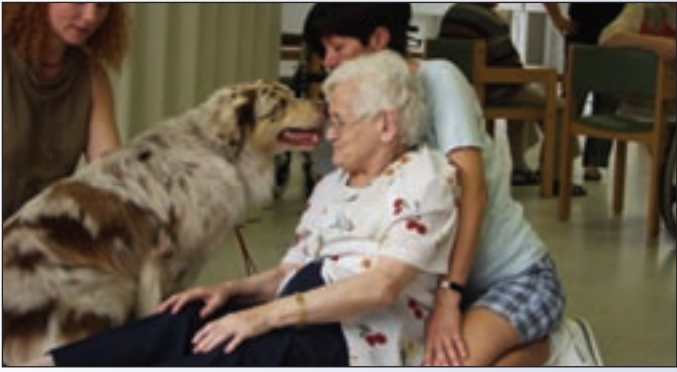
Geen moeite teveel om aai hond en patiënt bij elkaar te brengen.